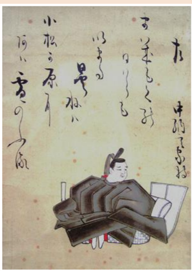
蘭明文庫伝来三十六歌仙絵「大伴家持」(書:鳥丸光広 画:不明)

も、政治の中核で藤原家との壮絶な権力闘争に巻き込まれていく家持、その波瀾万丈のヒーロンドラマが始まる。